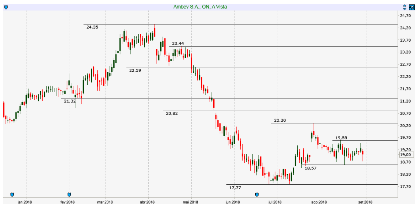
ABEV3 - Diário - criado em 31/08/2018

ANÁLISE TÉCNICA: Ativo fechou Gap em 19,00 e esperamos um movimento de recuperação buscando novamente resistência em 20,15. Suportes em 18,70 e 18,45.