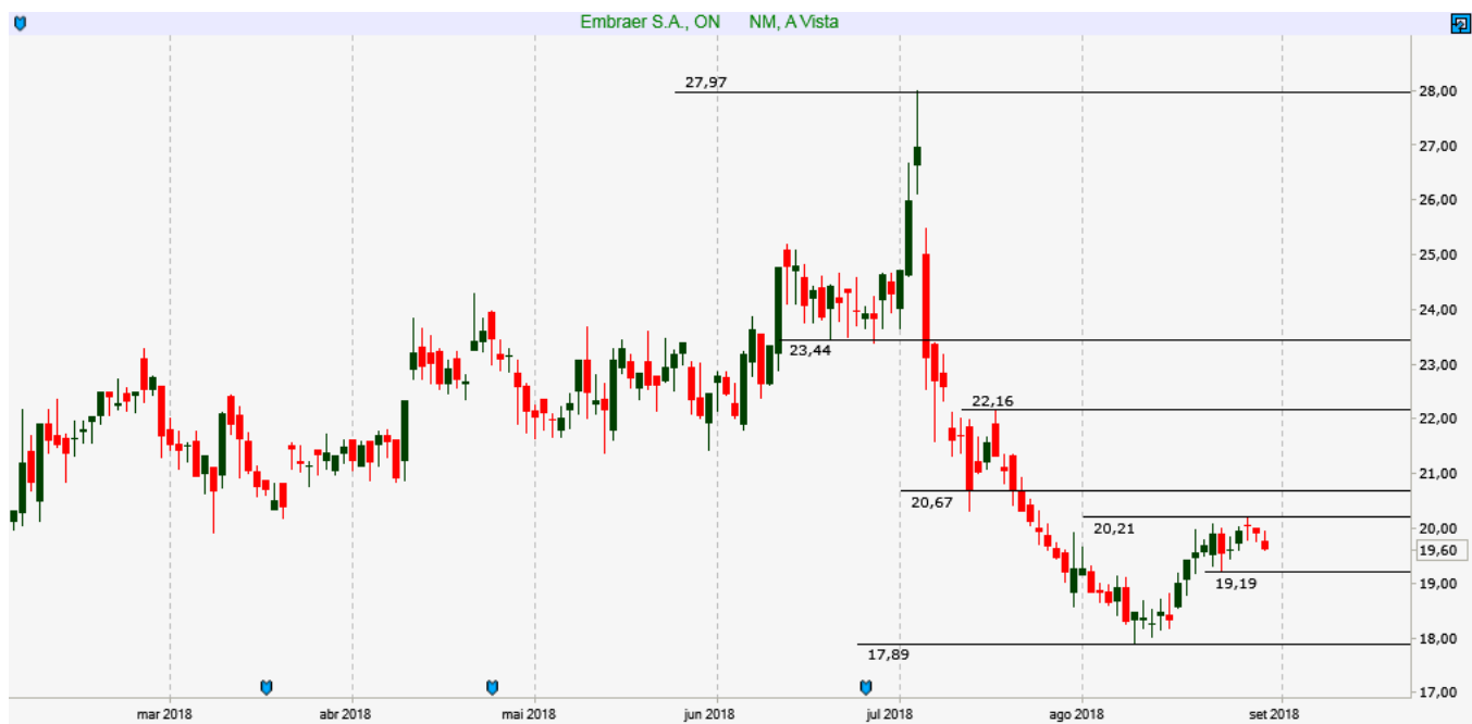
EMBR3 - Diário - criado em 31/08/2018

ANÁLISE TÉCNICA: Ativo começa a mostrar recuperação, deixando um fundo em 17,90. As resistências estão entre 20,20 e 20,70.