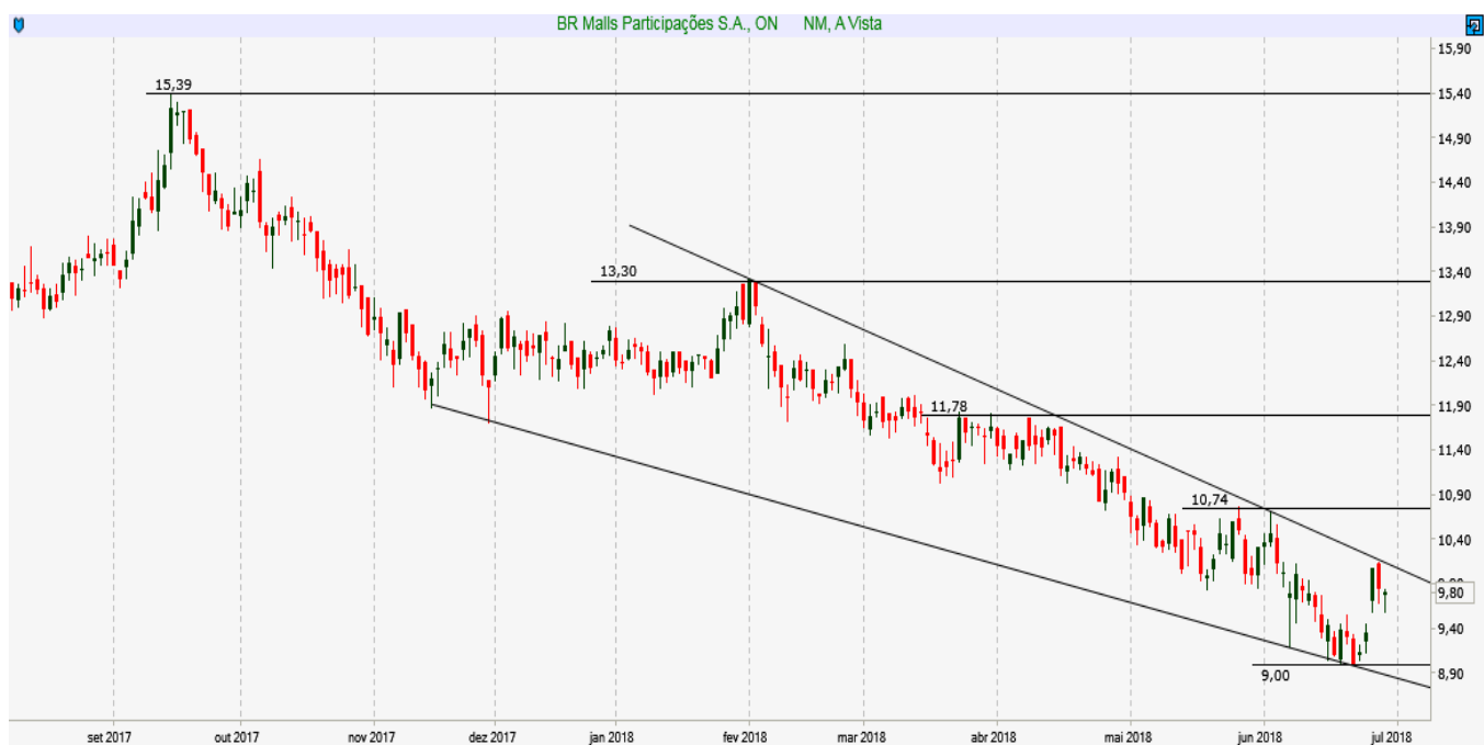
BRML3 - Diário - criado em 29/06/2018

ANÁLISE TÉCNICA: Ativo segue em tendência de baixa, mas pode romper resistência em 10,00 e gerar um sinal de recuperação no médio prazo.