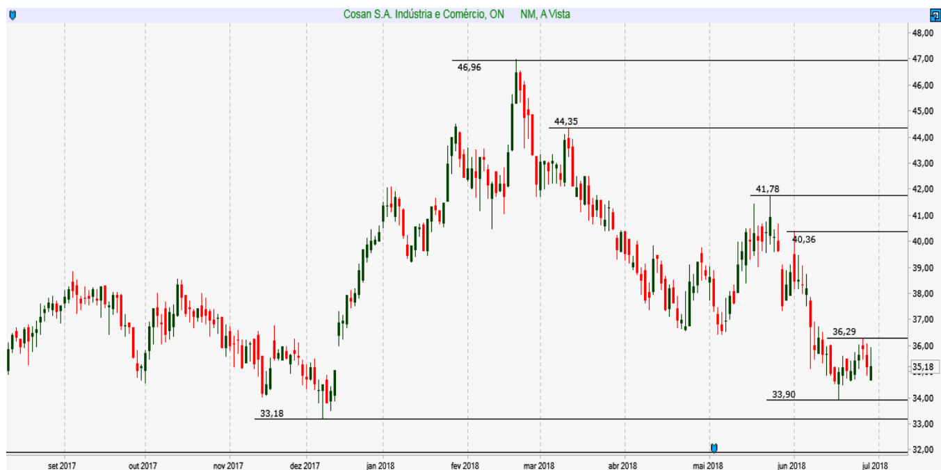
CSAN3 - Diário - criado em 29/06/2018

ANÁLISE TÉCNICA: Ativo fechou Gap em 35,00 e segue em zona de suportes importantes entre 34,00 e 33,20. Um sinal de alta seria no rompimento da resistência em 36,30.