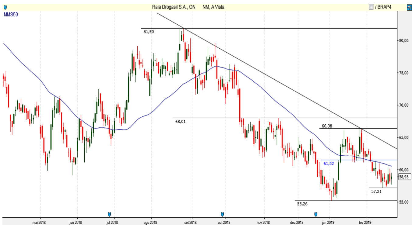
RADL3 - Diário - criado em 22/02/2019

ANÁLISE TÉCNICA: Ativo volta a ficar abaixo da média móvel e testa suportes em 58,80 e 57,30. Resistências em 61,50 e 64,00.