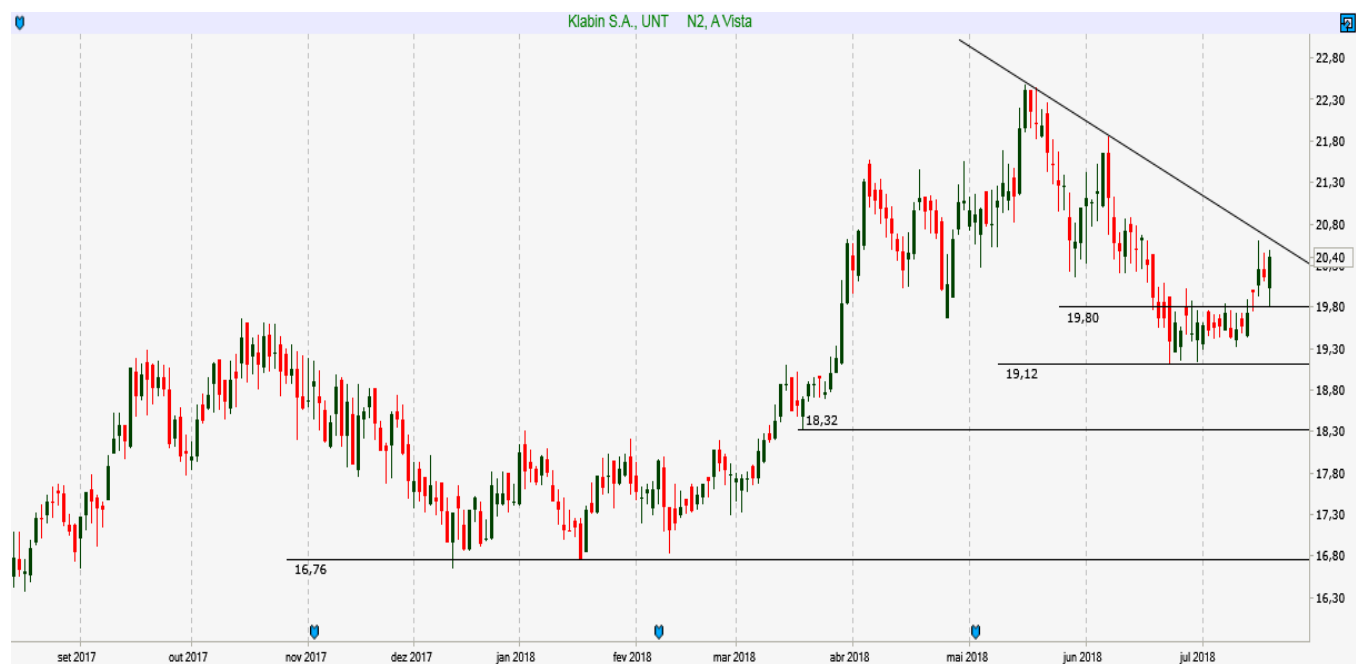
KLBN11 - Diário - criado em 20/07/2018

ANÁLISE TÉCNICA: Ativo ainda em tendência de alta no médio prazo, e atinge importante faixa de suportes entre 19,10 e 18,30. Um bom sinal de alta acontecerá no rompimento da resistência em 20,60.