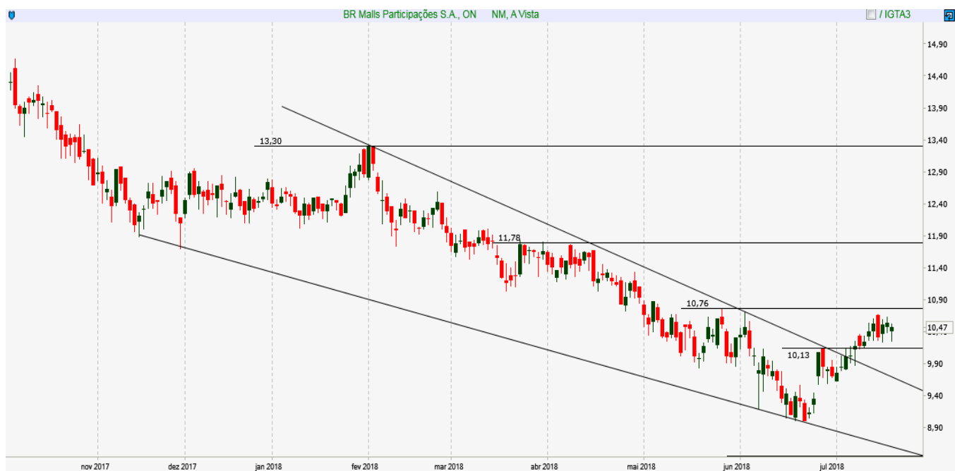
BRML3 - Diário - criado em 20/07/2018

ANÁLISE TÉCNICA: Ativo mostra recuperação enquanto acima de 10,15 e para gerar novo momento de compra precisa fechar acima de 10,76.