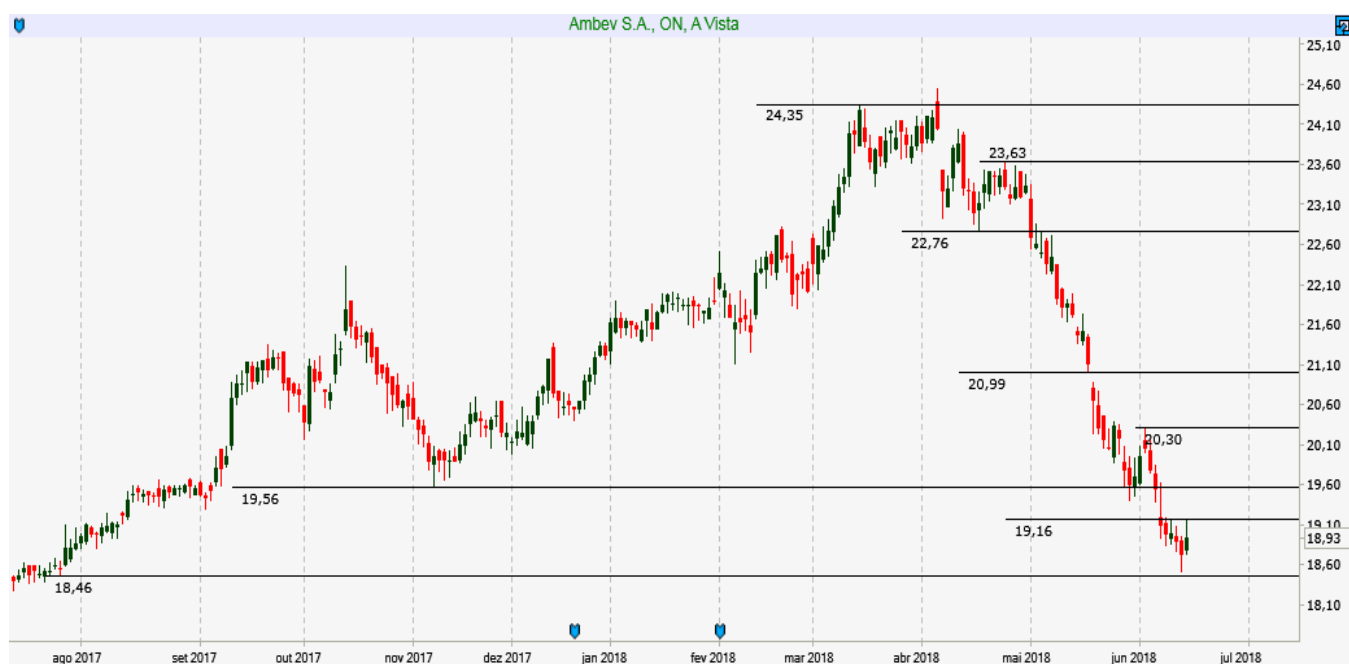
ABEV3 - Diário - criado em 15/06/2018

ANÁLISE TÉCNICA: Ativo realizou além do esperado, mas entra em nova zona de suportes importantes entre 19,00 e 18,50 onde deve encontrar força compradora.