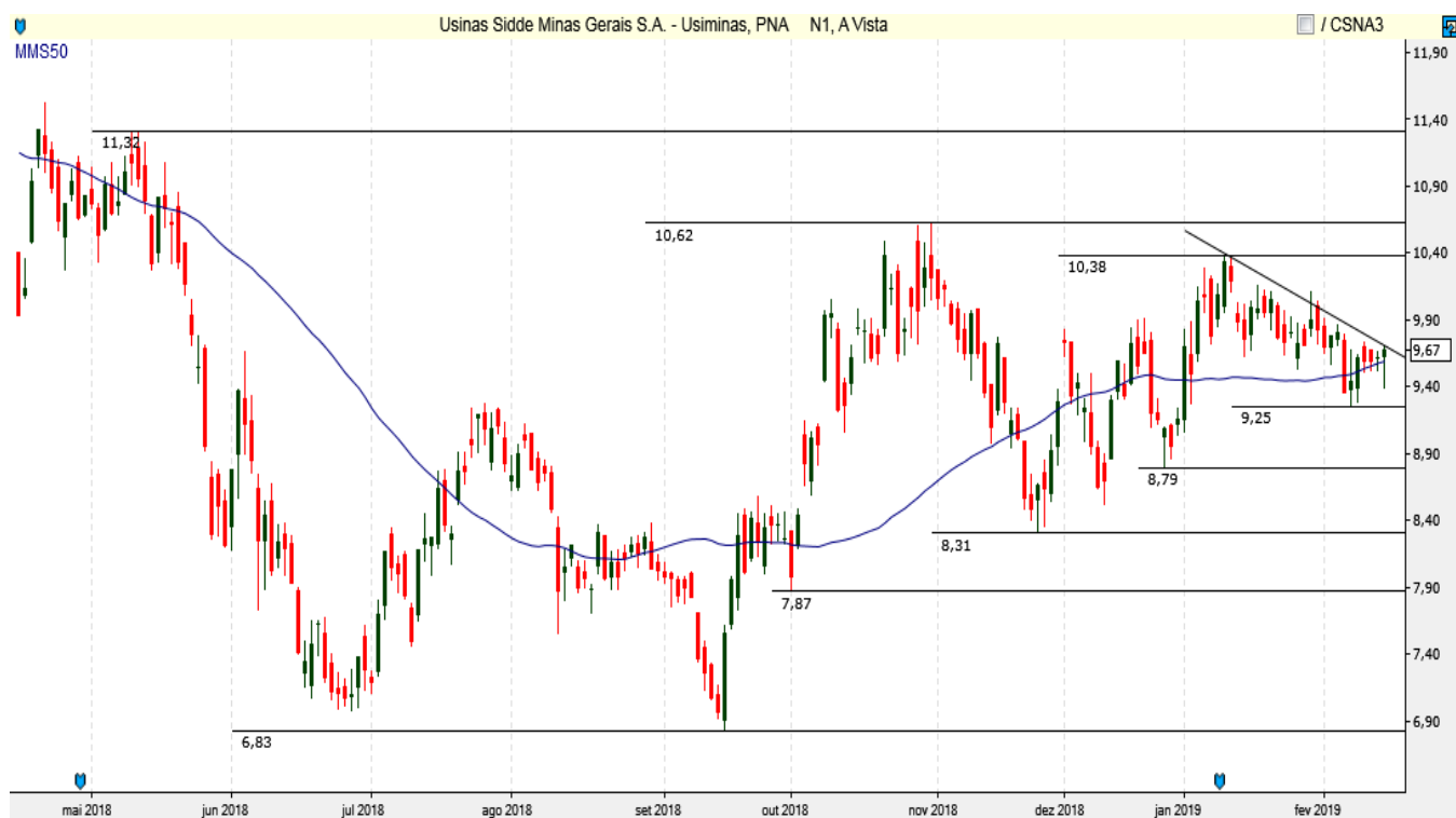
USIM5 - Diário - criado em 15/02/2019

ANÁLISE TÉCNICA: Ativo continua oscilando de forma lateral, mas a tendência de alta segue em aberto! Suportes 9,25/ 9,00 e 8,80.