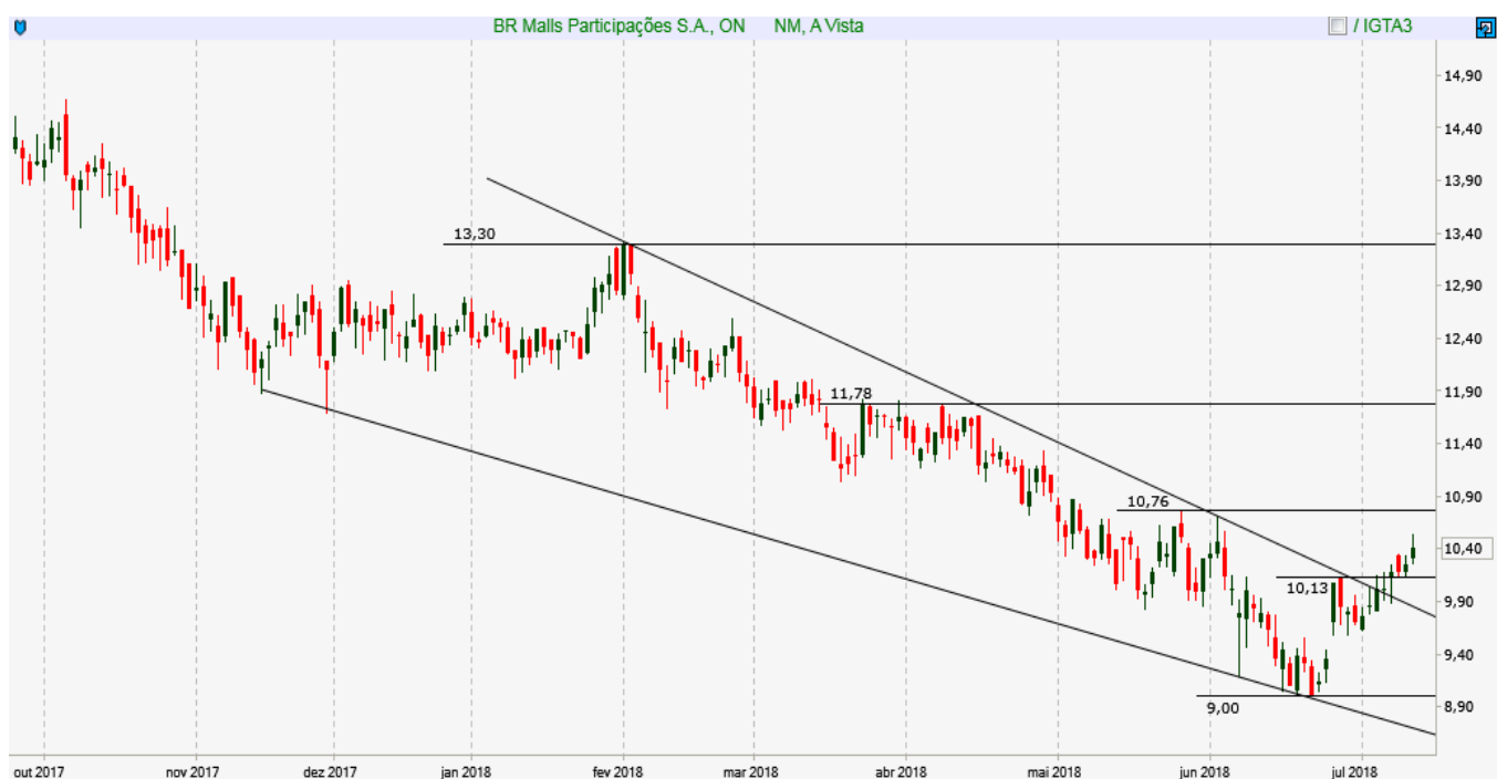
BRML3 - Diário - criado em 13/07/2018

ANÁLISE TÉCNICA: Ativo segue em tendência de baixa, mas pode romper resistência em 10,15 e gerar um sinal de recuperação no médio prazo.