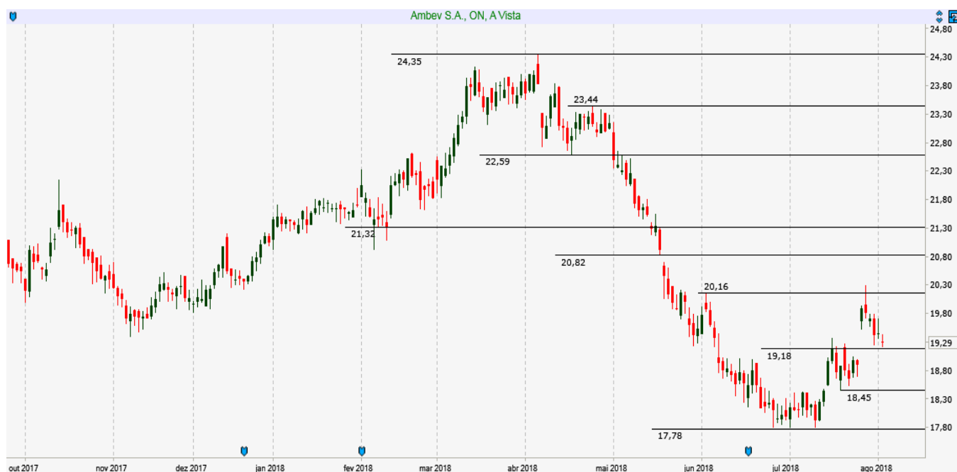
ABEV3 - Diário - criado em 03/08/2018

ANÁLISE TÉCNICA: Ativo rompeu resistência em 19,20, confirmando Pivot de Alta e alvos entre 20,15 e 20,80.